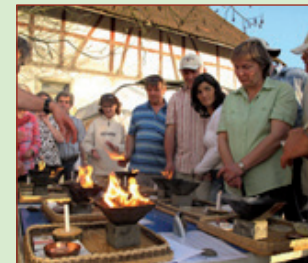
El Agnihotra se explica exhaustivamente en teoría y práctica.

Con este propósito se realizan frecuentes eventos informativos sin costo para los visitantes. Por favor, visite nuestra web para conocer las fechas correspondientes de los diversos seminarios y cursos.