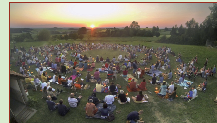
Nuestros encuentros anuales en los veranos permiten sobre todo el intercambio de experiencias.

El Homa-Hof es una granja modelo que ha logrado el éxito gracias al gran trabajo de voluntariado y apoyo de los asociados y donaciones en general. Agradecemos cualquier apoyo que nos permite promover el uso del Agnihotra. Les invitamos de todo corazón a ayudar, aprender, experimentar e intercambiar experiencias.