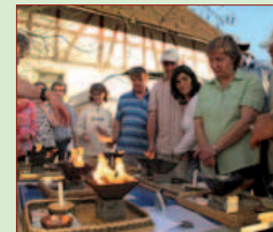
агниотра основательно объясняется теоретически и практически

Регулярно проводится бесплатный обмен опыта. Текущий план мероприятий излагается на нашей интернет страничке.